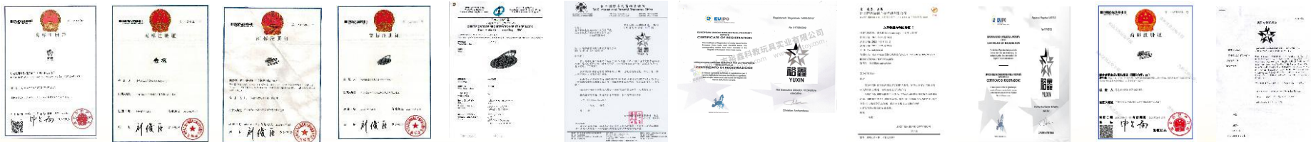
lg+裕鑫+YUXIN 叠杯41类 全脑博士41类 速叠杯42类 速叠杯香港 裕鑫台湾 裕鑫欧盟 欧盟2/3代速叠杯 欧盟裕鑫LG 美国商标 美国商标中文