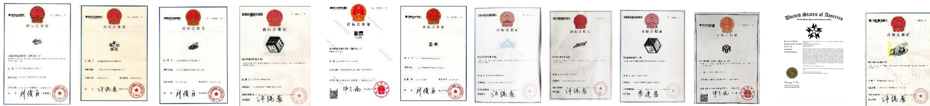
全脑博士28类 裕鑫LOGO 速叠杯 智胜28类 裕鑫+YUXIN 叠杯35类 益智玩官 智胜(文字) 智胜28类 海斯七阶logo 全脑博士35类 速叠杯28类

公司自建立以来，注重知识产权保护和市场规范管理工作。目前上市销售产品已注册国内17个、国际商标5个。