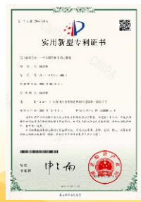
大颗粒积木动力模组