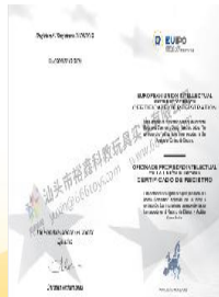
欧盟-三阶镜面魔方